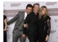
BERLIN Halbzeit bei der Berlinale 13.02.2017